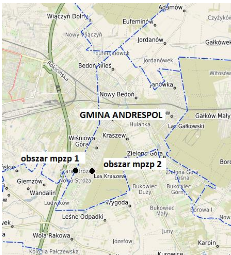
Położenie obszarów mpzp na tle gminy

Współrzędne geograficzne gminy wynoszą: od 51°67" do 51°70" szerokości geograficznej północnej oraz od 19°35" do 19°38" długości geograficznej wschodniej.