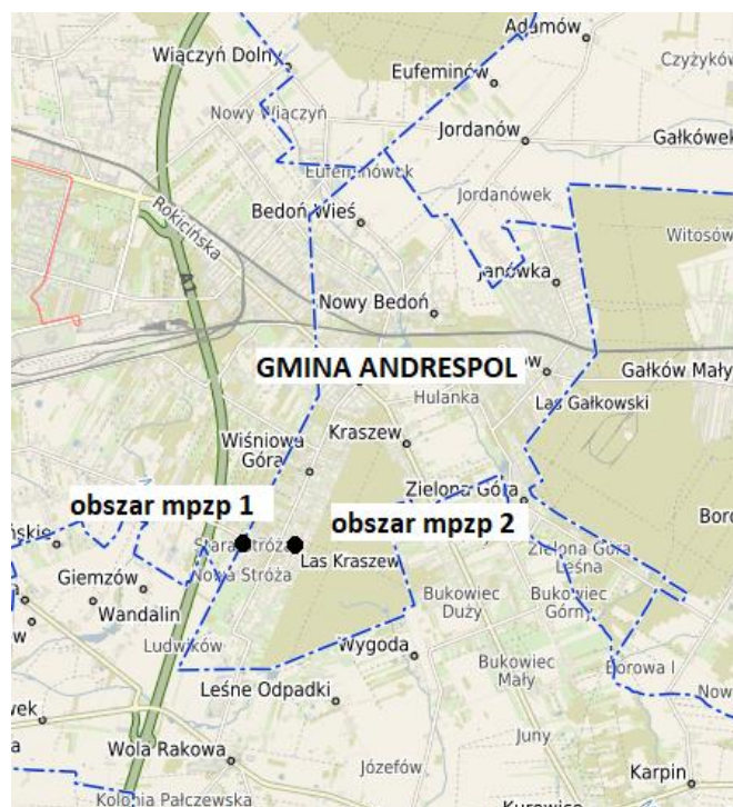
Położenie obszarów mpzp na tle gminy

Gmina Andrespol położona jest w centralnej części województwa łódzkiego, w powiecie łódzkim wschodnim. Przez Centrum gminy przebiega droga wojewódzka nr 713 relacji: Łódź - Kurowice - Tomaszów Mazowiecki - Opoczno. Przez gminę Andrespol przebiegają również linia kolejowa Łódź Fabryczna - Koluszki - Warszawa (znajdująca się w sąsiedztwie opracowania), która na lokalnym odcinku Łódź - Koluszki posiada istotne znaczenie w przewozach pasażerskich oraz druga linia kolejowa - z kierunku Łodzi Kaliskiej i Olechowa, włączona w układ torowy na wysokości stacji Bedoń, posiadająca znaczenie dla przewozów towarowych. Współrzędne geograficzne gminy wynoszą: od 51°67" do 51°70" szerokości geograficznej północnej oraz od 19°35" do 19°38" długości geograficznej wschodniej.