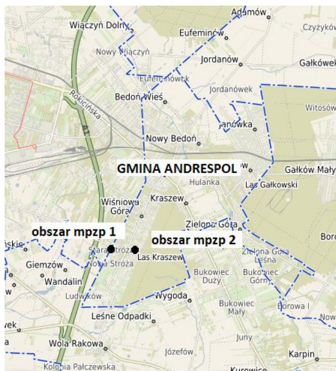
Położenie obszarów mpzp na tle gminy

Gmina Andrespol położona jest w centralnej części województwa łódzkiego, w powiecie łódzkim wschodnim. Przez Centrum gminy przebiega droga wojewódzka nr 713 relacji: Łódź - Kurowice - Tomaszów Mazowiecki - Opoczno. Przez gminę Andrespol przebiegają również linia kolejowa Łódź Fabryczna - Koluszki - Warszawa (znajdująca się w sąsiedztwie opracowania), która na lokalnym odcinku Łódź - Koluszki posiada istotne znaczenie w przewozach pasażerskich oraz druga linia kolejowa - z kierunku Łodzi Kaliskiej i Olechowa, włączona w układ torowy na wysokości stacji Bedoń, posiadająca znaczenie dla przewozów towarowych. Współrzędne geograficzne gminy wynoszą: od 51°67" do 51°70" szerokości geograficznej północnej oraz od 19°35" do 19°38" długości geograficznej wschodniej.